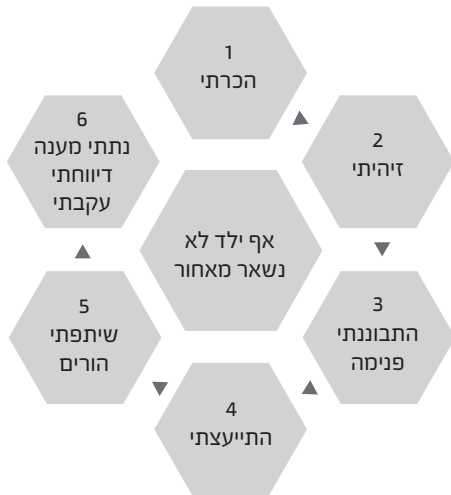
מודל 2: כוורת הרצף

ניסיתי להבחין בין עובדות לפירושים. הקשבתי לרגשות שעלו בי נוכח התנהגותו של הילד ותוך כדי האינטראקציה עמו. התבוננתי בעמדות שמצאתי בתוכי כלפי הילד וכלפי הוריו. שאלתי את עצמי כיצד משפיעים רגשות ועמדות על הפרשנות שנתתי לסיטואציה ועל הפעולות שאנקוט בהמשך. 14