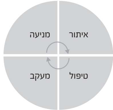
מודל 1: עוגת הרצף

"איזהו חכם? הרואה את הנולד". 7 ראיית הנולד שני פנים לה: (א) ראו את הרך הנולד, 8 הכירו את הילד ואת צרכיו; (ב) ראו את שעתיד להיוולד: הקדימו תרופה למכה, בנו גשר על הנהר בטרם ייפול הנופל ממנו. "החברה בישראל מחויבת לאמץ כיווני מדיניות ואסטרטגיות-פעולה כדי למנוע היווצרות של מצבי סיכון ומצוקה, ולא רק כדי לסייע במצבים אלו [...] לפעולות מניעה יש עדיפות מפורשת במכלול הפעולות למימוש מחויבות החברה כלפי ילדים ובני נוער בסיכון" 9 - כך נכתב בדוח ועדת שמיד (2006), שעל יסודו התקבלה החלטת הממשלה להקים את 360° התכנית הלאומית לילדים ולנוער בסיכון. משמעות מיוחדת יש למניעה