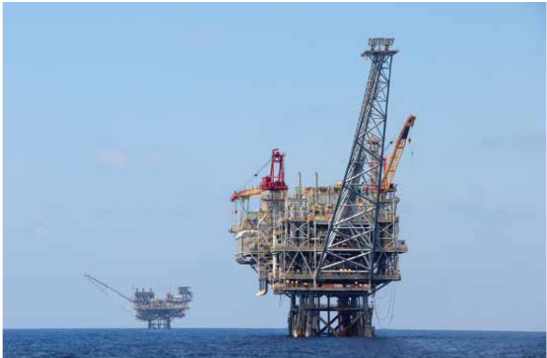
אסדת קידוח מול חופי ישראל

העולם נכח בעבר הלא רחוק באסונות אקולוגיים כבדים שגרמו פעילויות נפט וגז, למשל במפרץ ולדז שבאלסקה (1989) ובמפרץ מקסיקו (2010). בים התיכון אסון מסוג זה עלול להיות אף חמור עוד יותר, בהיותו ים סגור כמעט לגמרי