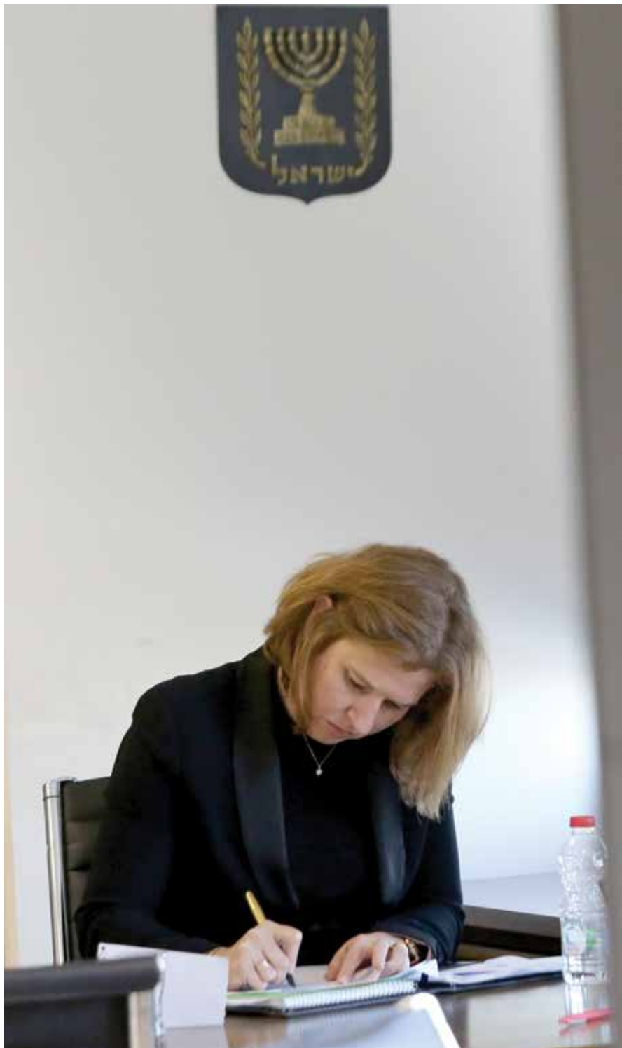
"אני לא חובבת התערבות יתר בחיים המסחריים השוטפים במדינה". השרה לבני

פני-גיל: עלתה הצעה שרק מי שיש לו תואר מתקדם יוכל לעסוק בפועל במקצוע. לא שקלתי את זה, ואני לא חושבת שה-