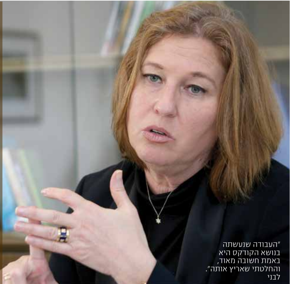
"העבודה שנעשתה בנושא הקודקס היא באמת חשובה מאוד, והחלטתי שאריץ אותה." לבני

"בכמה חוקים האזכור לבני זוג הוא במילים 'איש ואישה'. זה לא מקובל עליי. צריך להתייחס לבני זוג גם אם הם מאותו מין, וזה נושא שבממשלה הזאת קשה עד בלתי אפשרי לקדם אותו, אבל אני מתכוונת לנהל את המאבק הזה"