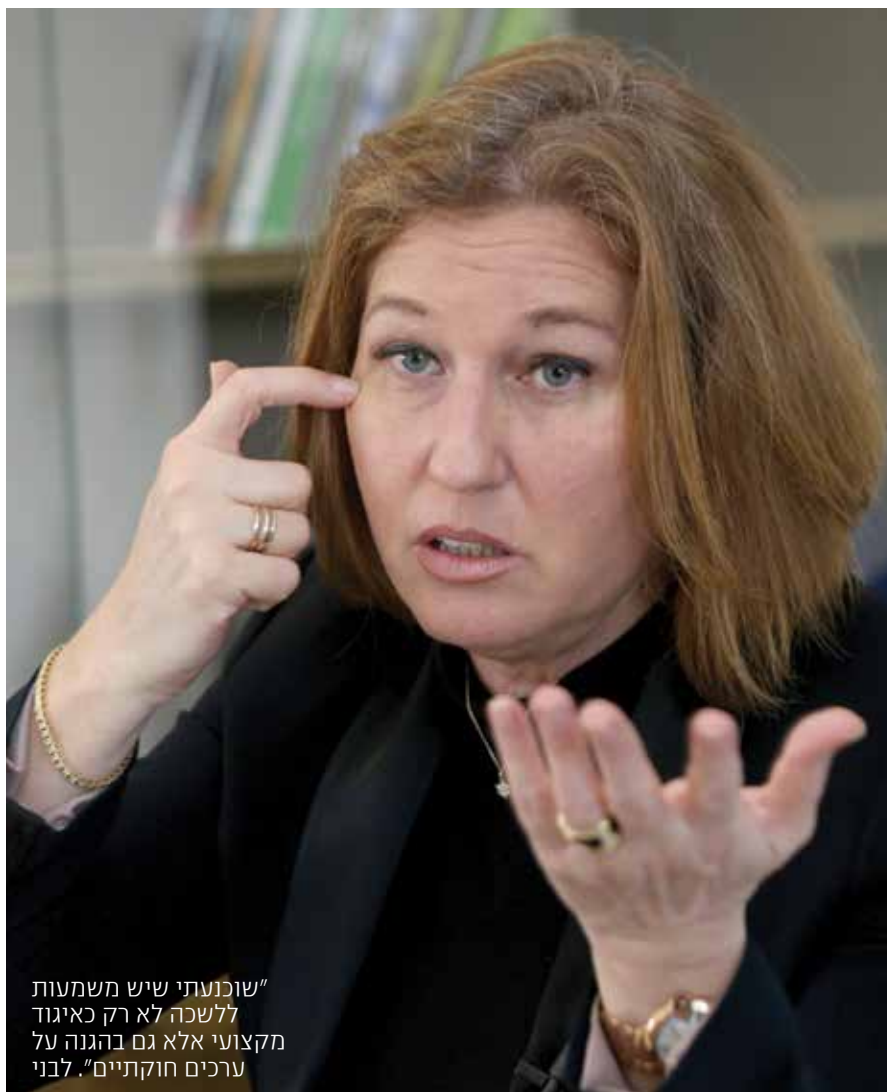
”שוכנעתי שיש משמעות ללשכה לא רק כאיגוד מקצועי אלא גם בהגנה על ערכים חוקתיים”. לבני