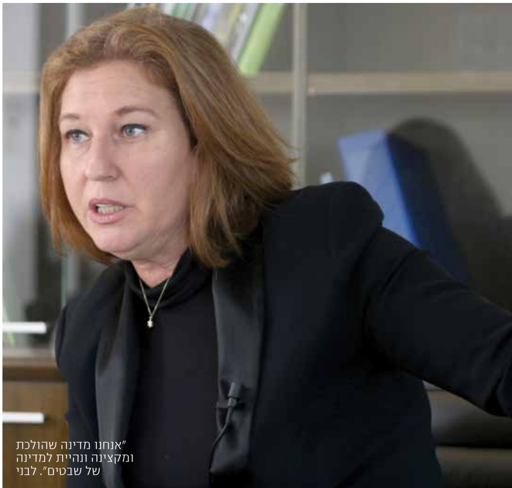
"אנחנו מדינה שהולכת ומקצינה ונהיית למדינה של שבטים". לבני

כצמן: מצוין. אני חושב שבגדול מבחינים באיזו הקלה מסוימת, אבל עדיין העומס רב. היו ועדות שעסקו בעניין, והשאלה היא איך את חושבת להקטין את העומס.