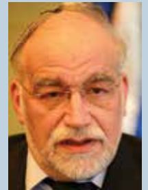
דוד רותם הליכוד - ביתנו