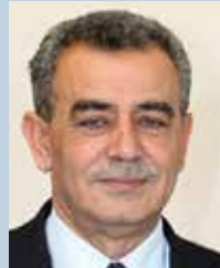
ג'מאל זחאלקה בל"ד