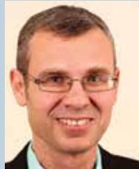
יריב לרין הליכוד - ביתנו