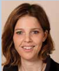
עדי קול יש עתיד