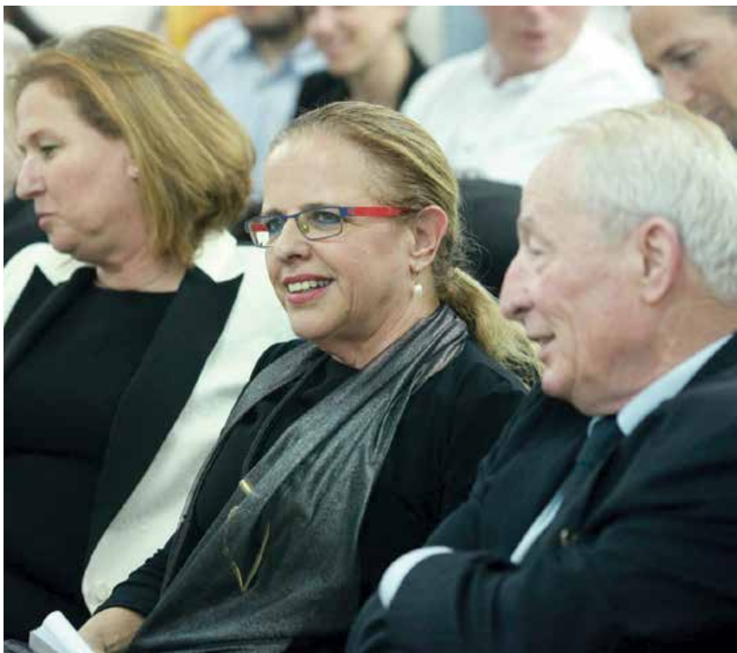
"השיפוט לא חסר לי". בטקס חנוכת הנציבות עם היועץ וינשטיין והשרה לבני, מאי 2014

לא מעט. עד היום אין שום מערכת תמיכה מינהלית ורגשית בשופט. עוזר משפטי אחד לשופט מחוץ עמוס לא מספיק, צריך לפחות שניים. מעבר לזה, הציבור הכללי ואפילו עורכי הדין לא יודעים ששופט רגיל