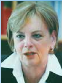
דורית ביניש 1989-1995