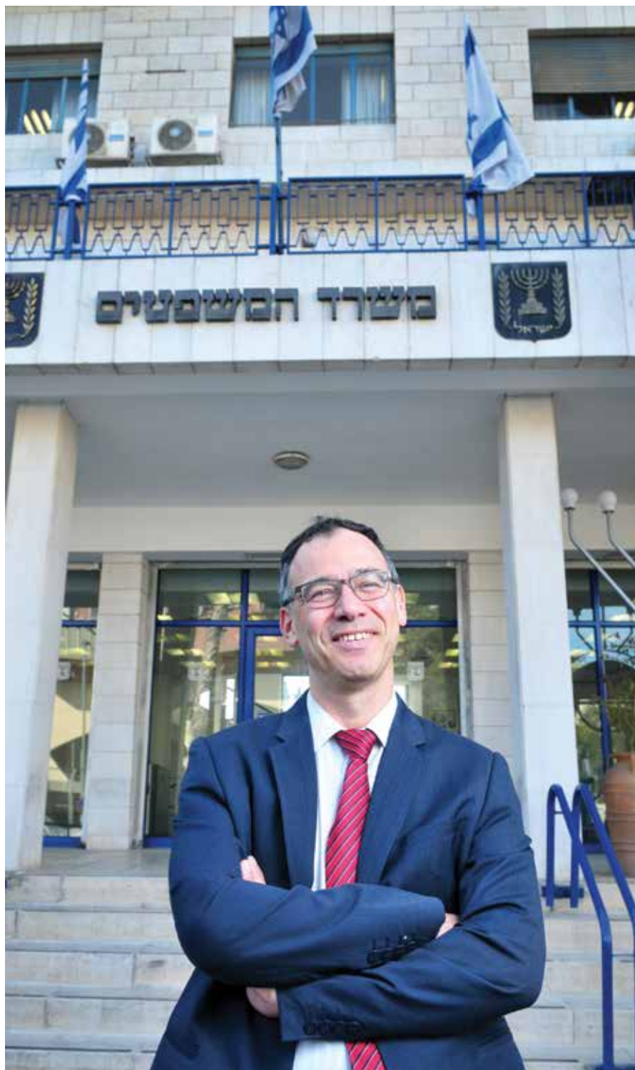
"קלון? שבע שנים זה הרבה. אנחנו לא מוציאים להורג פה". בכניסה למשרד המשפטים

אנחנו לא מנהלים שום תיק בתקשורת. הזירה שלנו היא בית המשפט. כמובן מה שהגשנו לבית המשפט ידוע לציבור ולת-