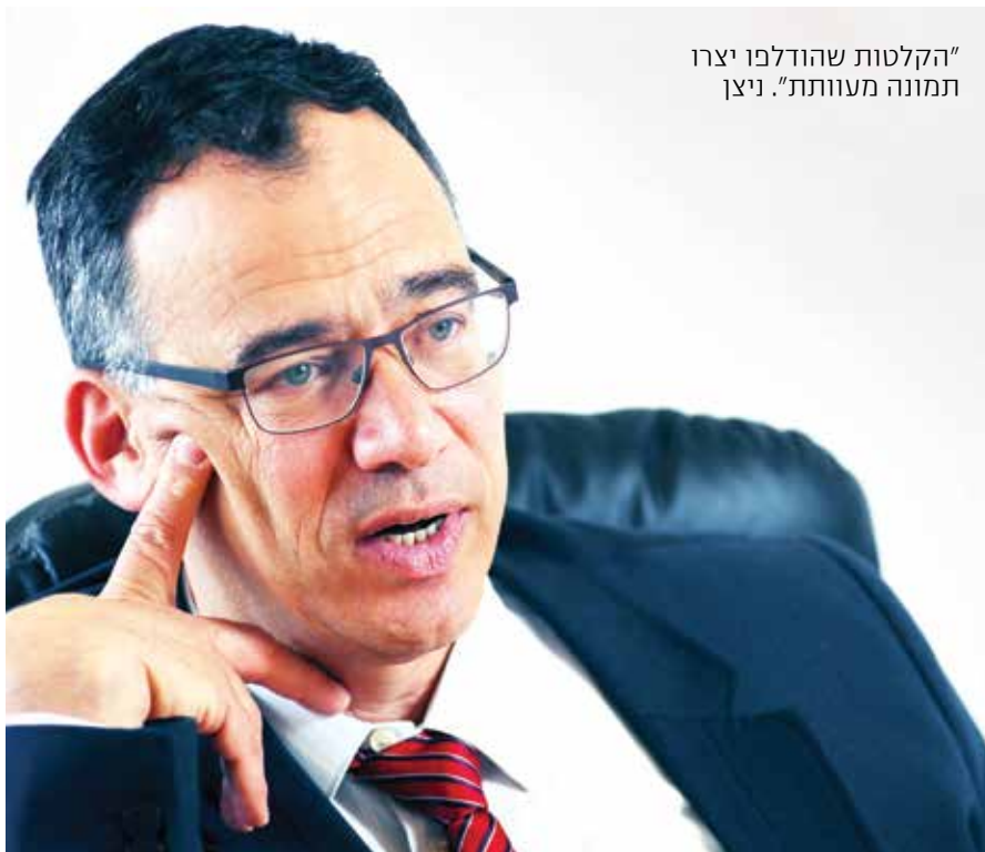
“הקלטות שהודלפו יצרו תמונה מעוותת”. ניצן

הפרקליטות היא גוף ברמה אנושית גבוהה מאוד, ואנחנו מתגאים בזה. בטקס ההסמכה האחרון של עורכי הדין החדשים, בנשאתי נאום ברכה, כשעלו המצטיינים