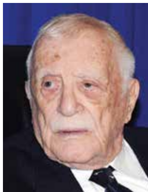
פרופ' שבתאי רוזן (עד לפטירתו ביום 21.9.10)