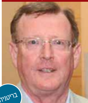
לורד דייויד טרימבל