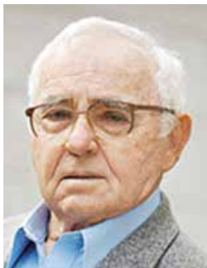
האלוף (במיל') עמוס חורב