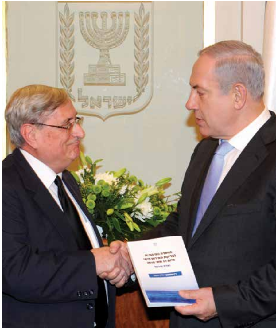
"בג"ץ צריך לדעת בעצמו את גבולותיו". עם ראש הממשלה נתניהו במעמד מסירת הדו"ח