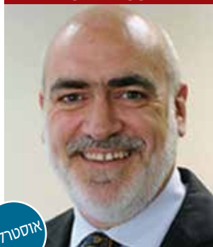
פרופ' טימותי מק'ורמק