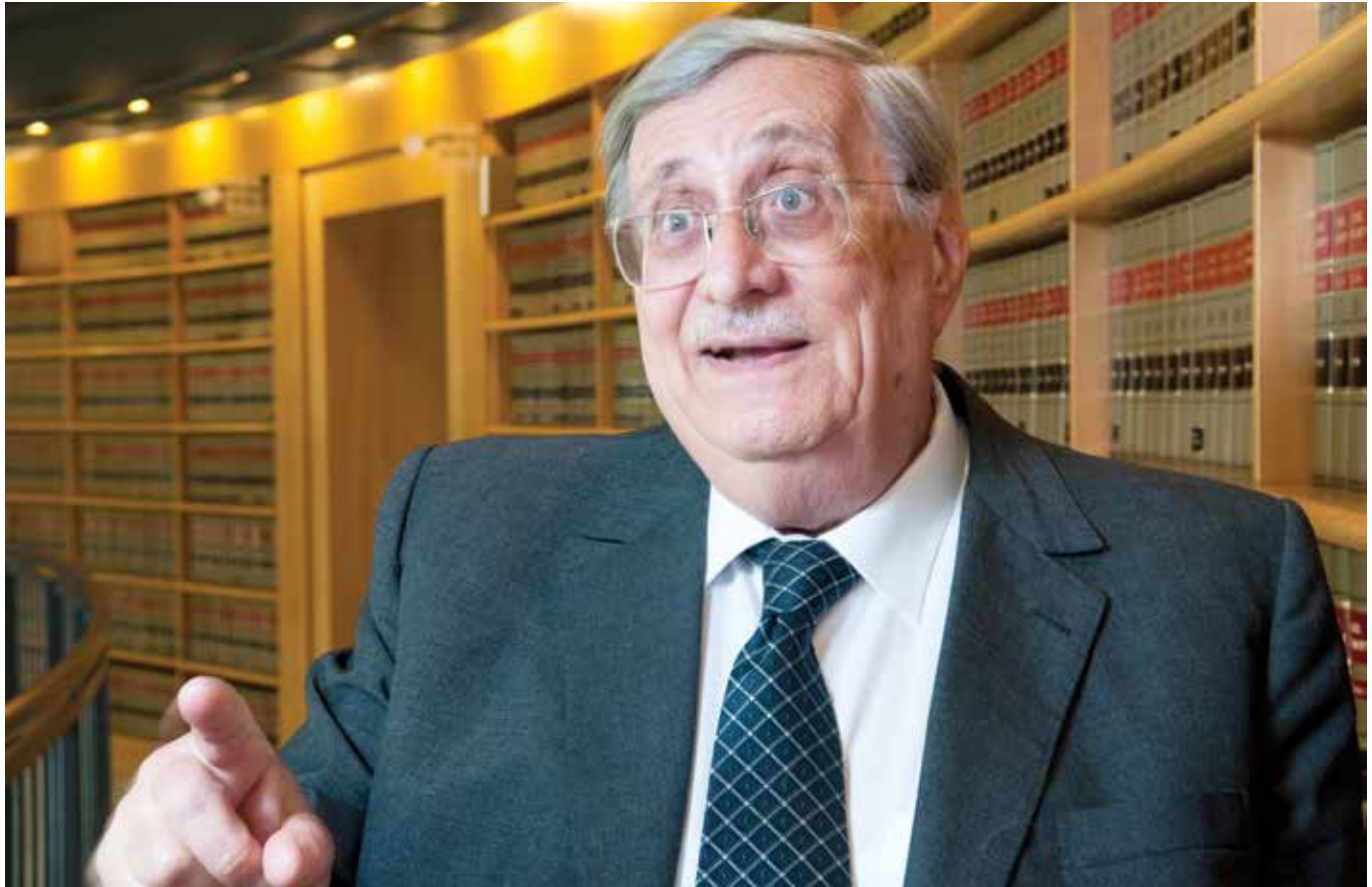
“אנחנו יותר בסדר מכולם. והאמת? לא התכוונתי לזה, לא היינו מכווני מטרה. כך יצא”. טירקל

כל אירוע שמצריך חקירה. אפשר להיות בטוחים שאם היום יטענו כלפי צה"ל שירו או הפציצו בית ספר מסוים או מקום של אונר"א, יש תיק שמפרט בדיוק את כל ההוכחות, יען כי ירו מתוכו. הכל מוכן.