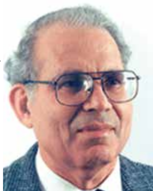
השגריר ראובן מרחב