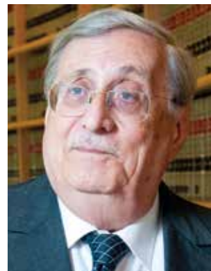
השופט (בדימ') יעקב טירקל