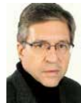
ד"ר יוסי ביילין, שר המשפטים לשעבר; נשיא חברת "ביילינק"

מעציב אותי הקונצנזוס. אינני שומע קולות מבין השופטים שאומרים כי הם תומכים במשוב, אולם בהכירי רבים מהם, אינני מאמין שזהו המצב. אני משוכנע כי יש שופטים שכועסים על ההתנגדות הזאת אבל אינם מוכנים לצאת נגדה. וחבל לי, משום שרובם שופטים בעלי רמה גבוהה שעבודתם הקשה ראויה להערכה רבה.