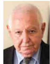
השופט בדימוס מיכה לינדנשטראוס, מבקר המדינה בשנים 2005-2012; לשעבר נשיא בית המשפט המחוזי בחיפה

ההגנה על בעלי חיים אינה מן הבעיות הבעורות במדינה בעת הזו. עם זאת, מזמן לזמן אנו קוראים על פגיעה בחוק צער בעלי חיים (הגנה על בעלי חיים), תשנ"ד-1994, האוסר על התעללות לבעלי חיים. הנה חייל מתעד באכזריות את עצמו מטגן ציפור חיה בתוך סיר לווהט. כאן אנו קוראים על סוס פצוע, במצב קשה, שננטש על ידי בעליו בשטח פתוח ובמשך ארבעה ימים היה קשור לעץ. בשל מצבו הקשה של הסוס לא נותרה ברירה אלא לבצע בו המתת חסד. הנה ראינו בתקשורת, בתחקיר, משח"טה לעופות ובה כלובים לא תקינים, סורגים עקומים