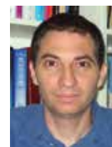
פרופ' ברק מדינה, הפקולטה למשפטים, האוניברסיטה העברית בירושלים

הזכות החוקתית לשוויון היא אבן יסוד של המשפט החוקתי ובה בעת אחת הסככות והשנויות במחלוקת. בין היתר אין הסכמה מהי הפליה, ולפיכך אילו אמות מידה להבחנה בין אנשים ("תבחינים") נחשבות מפלות. היה מקובל לסבור שיש להבחין בין שוויון מינהלי ובין שוויון חוקתי, אך פסיקת בית המשפט העליון מן השנים האחרונות מאופיינת במידה רבה בטשטוש ההבחנה הזו. התוצאה היא אי בהירות אשר לתוכנה של הזכות החוקתית לשוויון. ההבחנה המסורתית היא בין שני מובנים של האיסור להפלות. מובן אחד הוא החובה הכללית – לעיתים היא מכונה "החובה המינהלית" – לנהוג